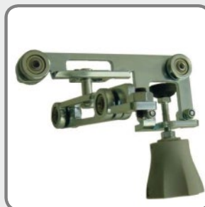
Doppelaufwagen mit Bremse p.o.