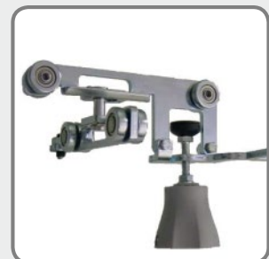
... und Mitnehmergabel für Stromabnehmer